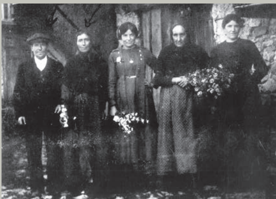
Trementinaires de Tuixent. C. 1920